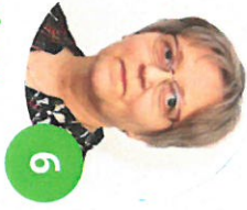
Soirntu Keski-Korpi lähihoitaja, eläkeläinen